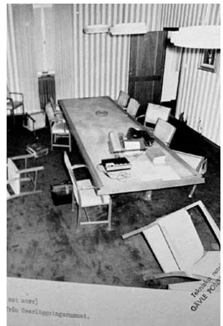
Det var på förmiddagen som de fyra personerna möttes i sammanträdesrummet.