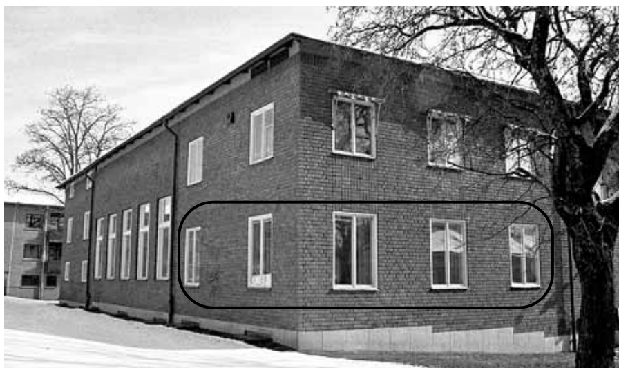
Tingshusmorden nämndes som det blodigaste brottet som drabbat en svensk rättsinstans. Det var här i sammanträdesrummet som mordet skedde.

som hela staden var belägrad av poliser som sökte efter honom.