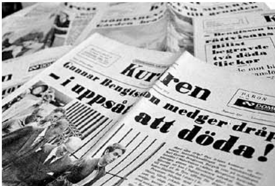
Hälsinge Kuriren 12 augusti 1971.

Nämndemännen vid tingsrätten idag säger att de inte pratar så mycket om händelsen. Men en av kvinnorna berättar att stolen med inbitna fläckar och ett kulhål genom ryggstödet, fortsatte att användas så som den var fram tills för bara några år