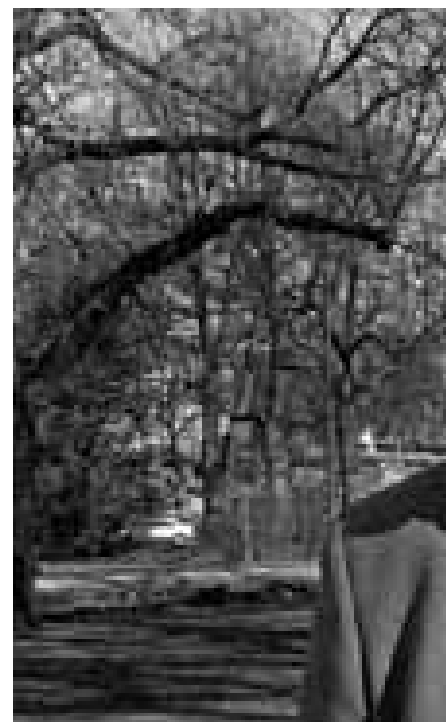
Det är i värnadtvister som de flesta överfall