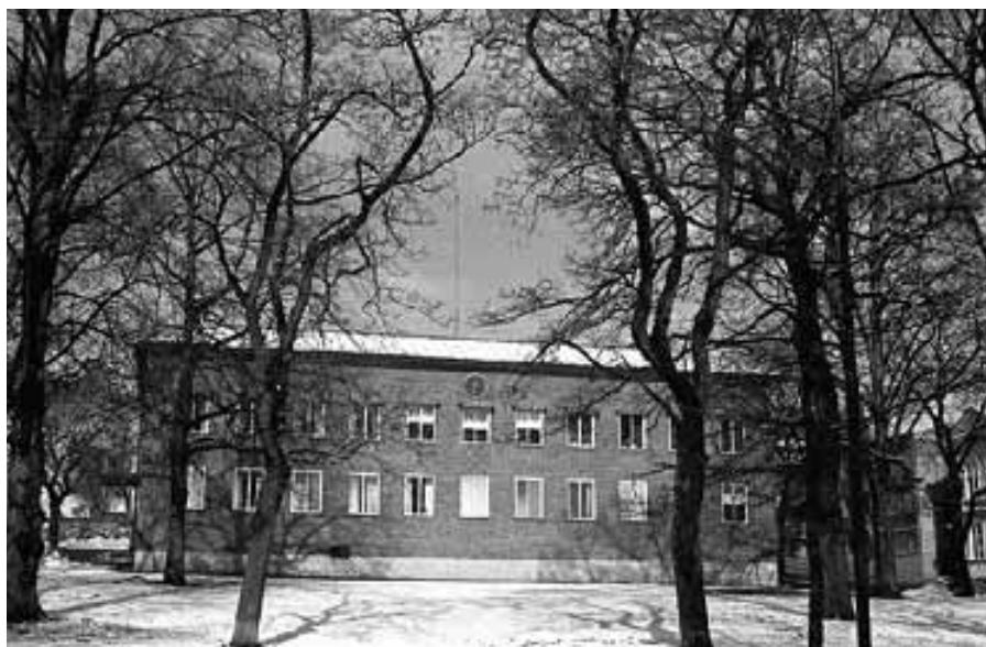
Tingshuset i Söderhamn är kulturmärkt, vilket betyder att tingsrätten inte kan bygga om lokalerna för att utöka säkerheten.